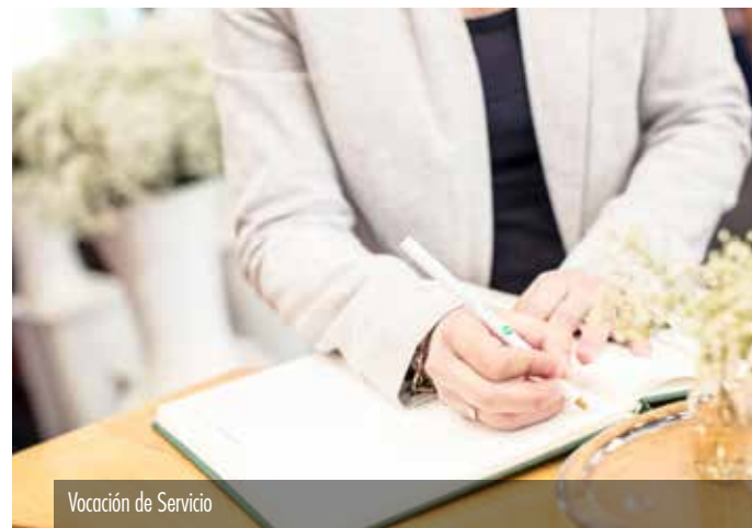
Vocación de Servicio

Un equipo profesional les acompaña y asesora en todo momento, ofreciéndoles todas las instalaciones municipales a nuestro alcance (tanatorios, crematorios y cementerios), así como con nuestra flota de vehículos fúnebres y de acompañamiento y un amplio abanico de servicios complementarios.