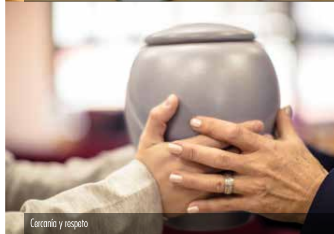
Cercanía y respeto